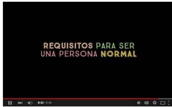
REQUISITOS PARA SER UNA PERSONA NORMAL , de Leticia Dolera Corte y Confección de películas / El Estómago de la Vaca